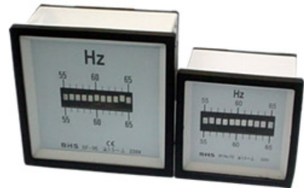
Tabela de escala

Conformidade IEC51, IEC-473 Visor de vidro. Moldura frontal em ABS na cor preta. Invólucro de material termoplástico em cor branca. Escala de alumínio em cor branca Fixação à porta de painel através de duas cantoneira com parafusos. Blindagem contra influência de campos magnéticos externo. Grau de proteção IP51 (frontal), IP00 (bornes). Temperatura de trabalho -10°C~+40°C. Temperatura de estocagem -20°C~70°C. Resistência ao choque max. 15g Resistência a vibração max. 2,5g Umidade ≤ 75% Consumo aproximado de 3VA/220V, 4VA/380V Tensão de prova de 2KA 60 Hz 1 min.